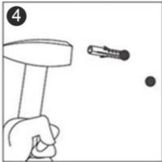
4. Plaats de pluggen in de gaten