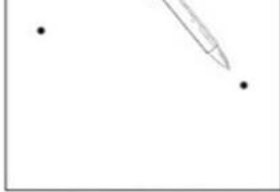
2. Zet puntjes op de muur