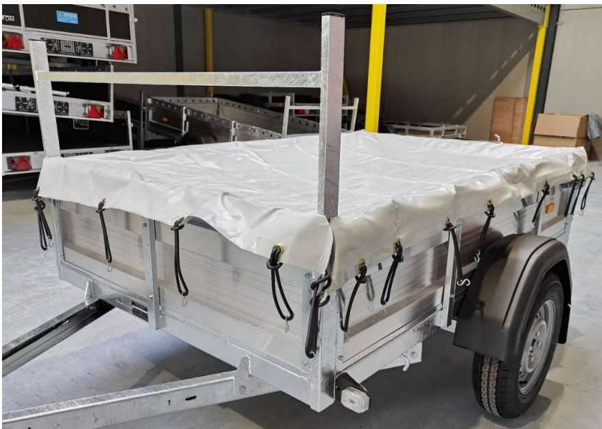
Afbeelding 9: bevestig alle elastieken aan het vlakzeil