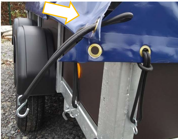
Afbeelding 4: Driehoek (die van de zijkanten komt)