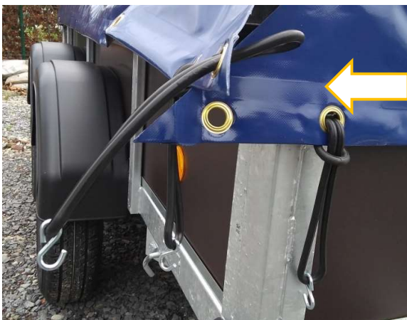
Afbeelding 5: Driehoek (die van de voorzijde komt)