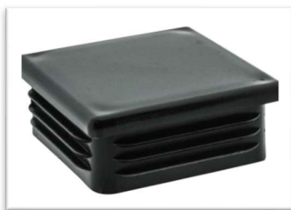
Afbeelding 17: Inslagdop voor kokerprofiel chassis (niet inbegrepen)

TIP: Zorg er voor dat alle kokerprofielen ook een inslagdop ( hebben, zodat het zeil niet over scherpe hoeken kan wrijven. Deze bestaan in zowel vierkante als rechthoekige uitvoeringen.