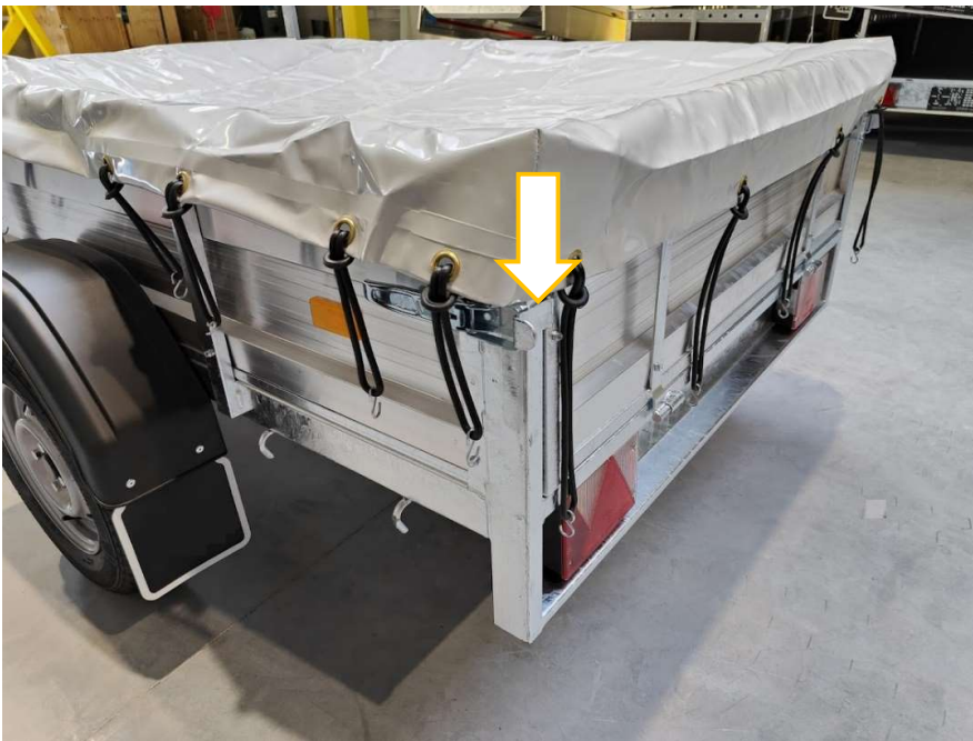
Afbeelding 7: Achterkant van het dekzeil

(1.2) Plaats de gestikte achterhoeken van het dekzeil over de hoekpalen.