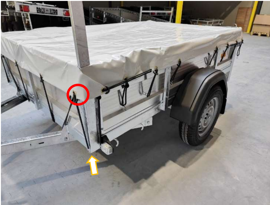
Afbeelding 12: Vlakzeil driehoek vooraan vasthaken

(3.3) Haak de elastieken van de voorste driehoek (die van de voorzijde komt) vertikaal vast aan het chassis