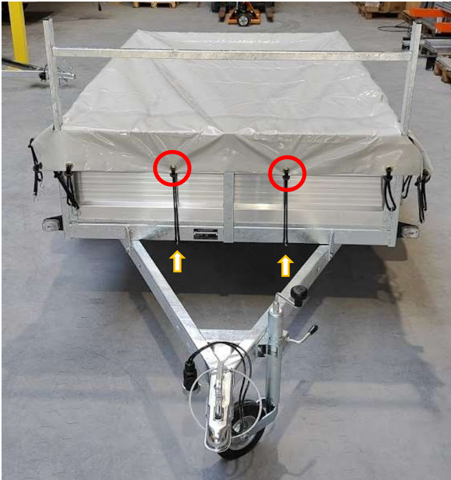
Afbeelding 8: 2 elastieken vooraan vasthaken als voorbereiding voor verdere montage

(2.3) Nu kun je gemakkelijk alle overige elastieken vastbinden aan het dekzeil.