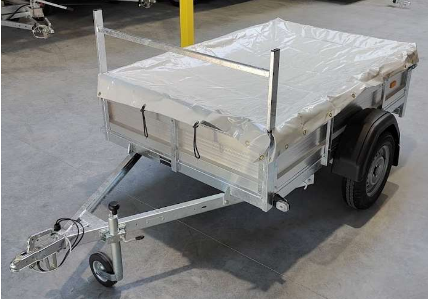
Afbeelding 6: Opengevouwen dekzeil

(1.1) Leg het vlakzeil open over de randen van de bak van de aanhangwagen.