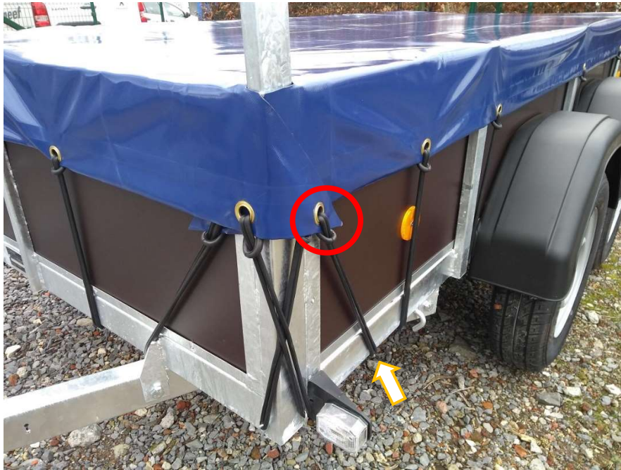
Afbeelding 14: vlakzeil driehoek vooraan schuin vasthaken