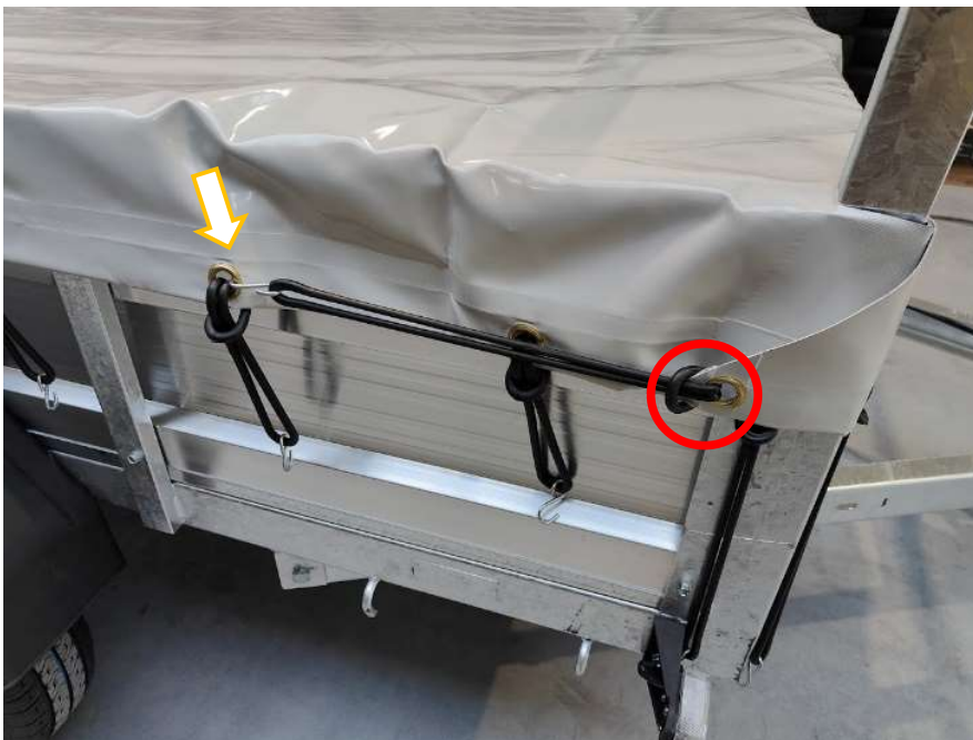
Afbeelding 13: Vlakzeil driehoek vooraan vasthaken

(3.4) Haak de elastieken van de voorste driehoek (die van de voorzijde komt) horizontaal vast aan het ringoog (Afbeelding 13), of je kunt die ook schuin naar beneden vasthaken (Afbeelding 14)