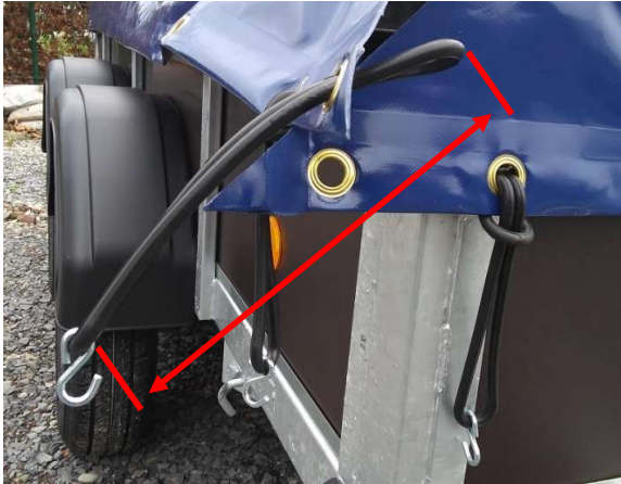
Afbeelding 3: Elastiek lengte 24 cm