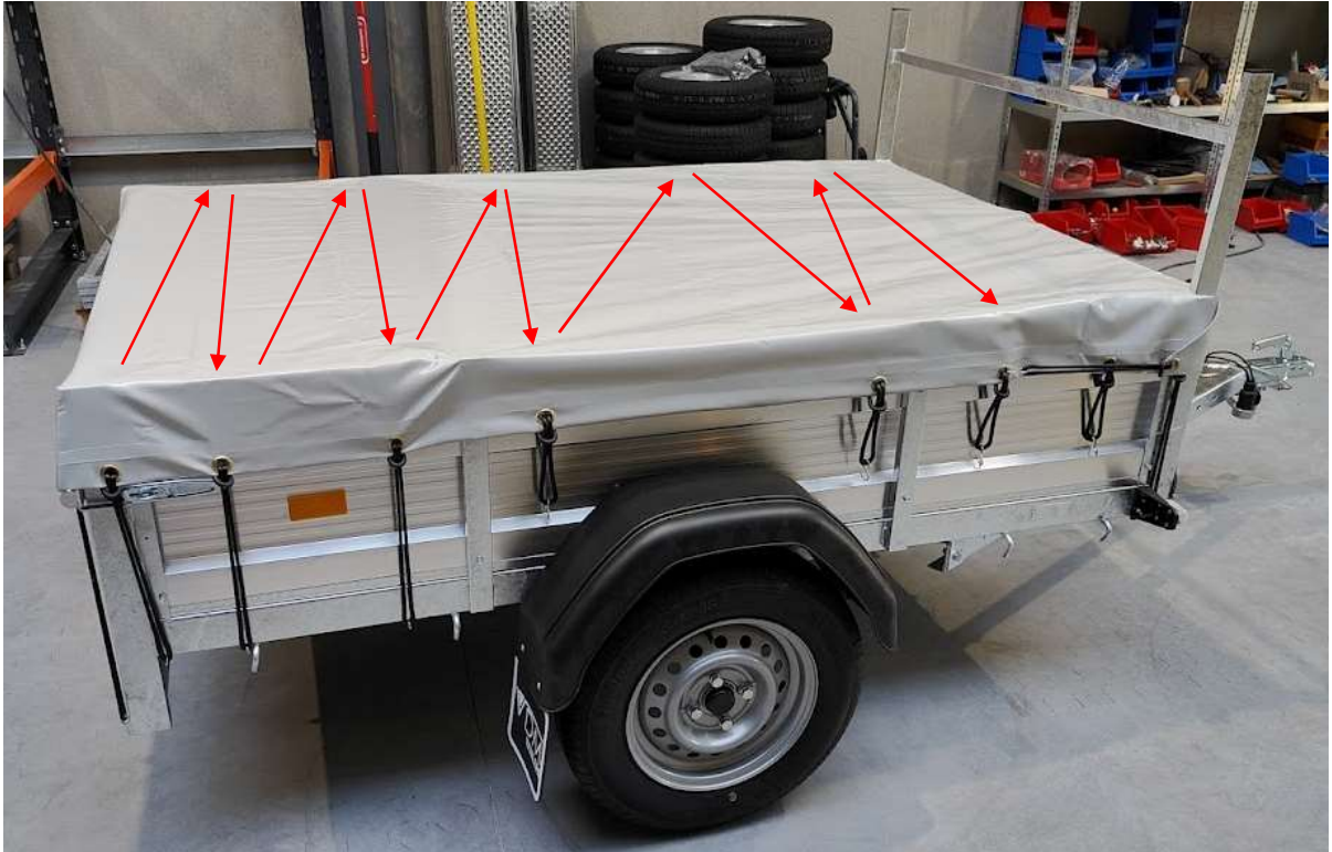
Afbeelding 16: elastieken beurtelings links & rechts vastmaken

Als je beurtelings links en rechts een elastiek vasthaakt blijft het zeil in het midden.