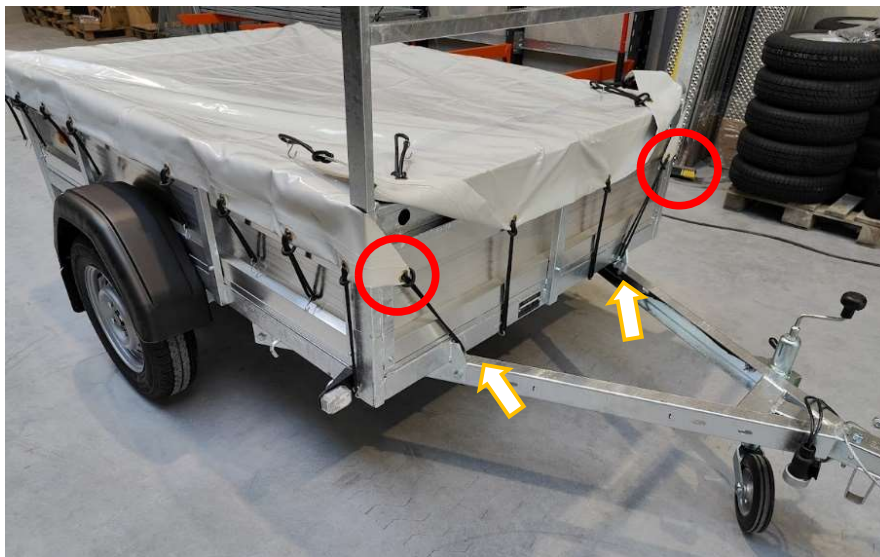
Afbeelding 11: Dekzeil driehoeken vasthaken

(3.2) Haak de elastieken (lengte 24cm) van de voorste driehoeken links en rechts vertikaal vast aan het chassis