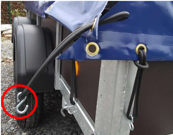
Afbeelding 2: S-haak vastgenepen aan een rubberen elastiek