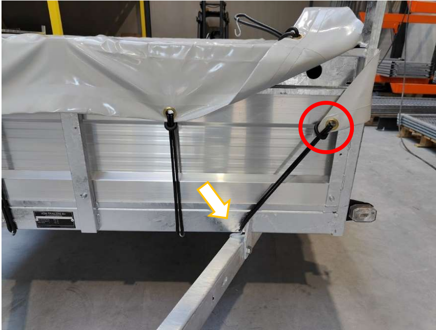
Afbeelding 10: Dekzeil driehoeken vasthaken

(3.1) Haak de elastieken (lengte 24cm) van de punt van de voorste driehoeken (die van de zijkant links en rechts komt) vast aan de V-dissel