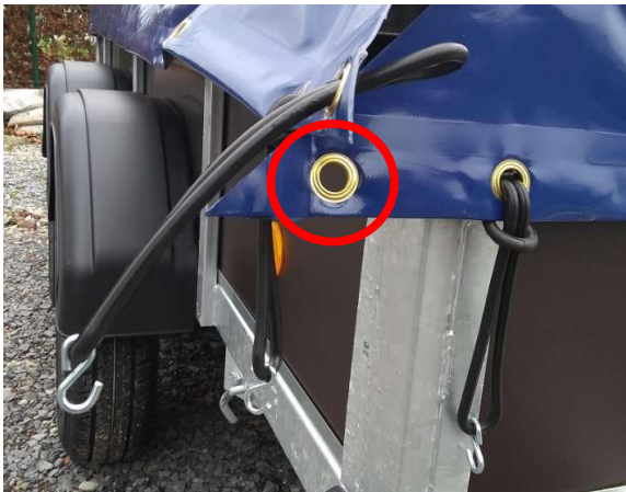
Afbeelding 1: messing zeilring ingeslagen in het vlakzeil