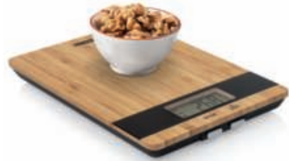
Bamboo kitchen scale 01.492944.01.001

PARTS DESCRIPTION / ONDERDELENBESCHRIJVING / DESCRIÇÃO DAS PEÇAS / TEILEBESCHREIBUNG / DESCRIZIONE DE LAS PIEZAS / DESCRIZIONE DOS COMPONENTES / DESCRIZIONE DELLE PARTI / BESKRIVNING AV DELAR / OPIS CZĘŚCI / POPIS SOUČÁSTÍ / POPIS SUČASTI / ОПИСАНИЕ ЗАПЧАСТИ