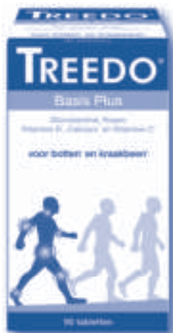
Treedo Basis Plus (ook verkrijgbaar in voordeelverpakking)