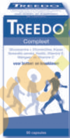
Treedo Compleet (ook verkrijgbaar in voordeelverpakking)

Treedo is een uniek stappenplan, afhankelijk van uw behoeften kunt u kiezen uit verschillende producten.