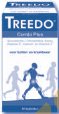
Treedo Combi Plus (ook verkrijgbaar in voordeelverpakking)