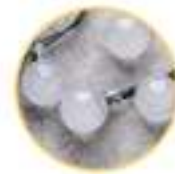
Ball diameter 23mm