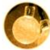
LED: warm white, f5