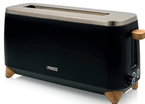
TOASTER Pure 01.1423261.01.001

PARTS DESCRIPTION / ONDERDELENBESCHRIJVING / DESCRIPTION DES PIÈCES / TEILBESCHREIBUNG / DESCRIPCIÓN DE LAS PIEZAS / DESCRIÇÃO DOS COMPONENTES / DESCRIZIONE DELLE PARTI / BESKRIVNING AV DELAR / OPIS ČEŠĆICI / POPIS SOUČÁSTI / POPIS SÚČASTI