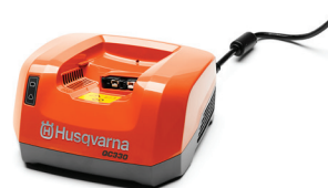
HUSQVARNA ACCULADER 970 52 22-01