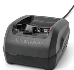
HUSQVARNA OPLADER QC250 967 97 01-01