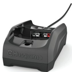
ACCULADER 40-C80 970 48 78-01