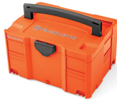
HUSQVARNA ACCUBOX M 597 16 85-01