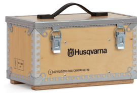
ACCUBOX 529 47 51-01