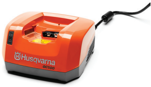
HUSQVARNA OPLADER QC500 970 44 95-01