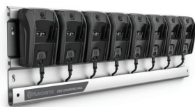
HUSQVARNA 40-C80 CHARGING STATION 970 62 19-01