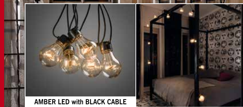
AMBER LED with BLACK CABLE

UTOMHUS • AUSSEN • OUTDOOR • EXTÉRIEUR ULKOKÄYTTÖÖN • UDENDØRS • BUITENSHUIS • ZEWNETRZNE • EXTERIEUR