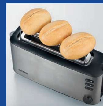
DE Integrierter Brötchen-Röstaufsatz GB Integral bun warmer FR Support intégré pour réchauffer des petits-pains NL Geïntegreerde broodjesopzet DK Integreret bollerster ES Calentador de panecillos integrado IT Griglia scaldapanni integrata PL Wbudowany ruszt na bułki

DE Krümelschublade zur leichteren Reinigung, automatische Abschaltung bei Verkleben einer Brotscheibe GB Easy to clean crumb tray, automatic switch-off in case of bread jam FR Tiror ramasse-miettes facile à nettoyer, arrêt automatique si une tranche de pain se coince NL Krummelade voor eenvoudige reiniging, automatisch uitschakelen wanneer brood beklemt raakt DK Krummebakke for lettere rengøring, slukker automatisk hvis brødet sidder fast ES Bandeja recogemietas de fácil limpieza, desconexión automática cuando el pan se atasca IT Vassoio raccogli-miettes facile da pulire, spegnimento automatico in caso di blocco del pane all'interno PL Ustawiająca czyszczenie tacka na okruchy, automatyczne wyłączenie w przypadku zatkania się pieczywa