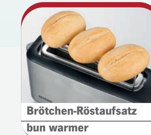
Brötchen-Röstaufsatz bun warmer