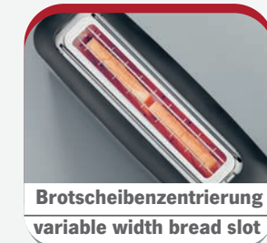
Brotscheibenzentrierung variable width bread slot