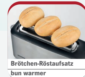
Brötchen-Röstaufsatz bun warmer