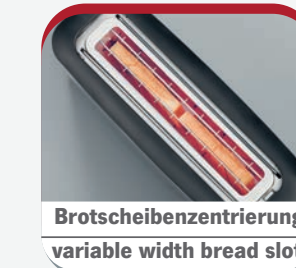
Brotscheibenzentrierung variable width bread slot