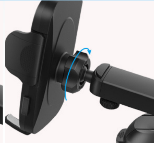
3. Draai de schroef aan