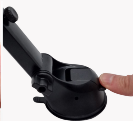
5. Bevestig de houder en druk op de vergrendelingshendel