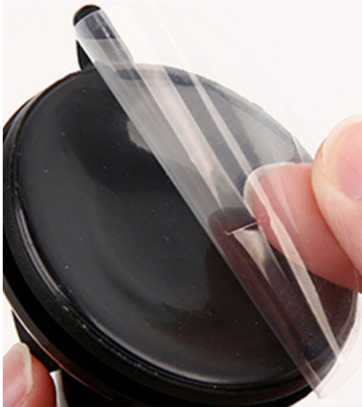
4. Verwijder de bescherming