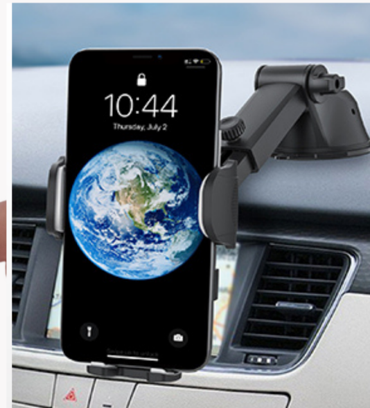
6. Plaats je apparaat in de beugel.