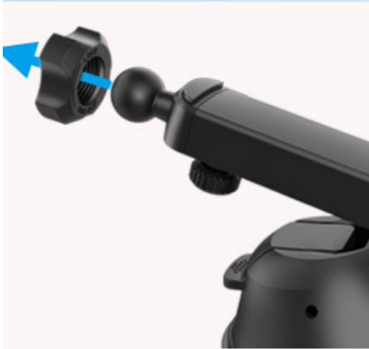
1. Plaats de verstelbare inrichter in de kogelgewrichtadapter