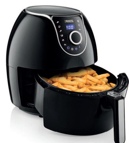
Aerofryer XXL 01.182055.01.001

PARTS DESCRIPTION / ONDERDELENBESCHRIJVING / DESCRIPTION DES PIÈCES / TEILEBESCHREIBUNG / DESCRIPCIÓN DE LAS PIEZAS / DESCRIÇÃO DOS COMPONENTES / DESCRIZIONE DELLE PARTI / BESKRIVNING AV DELAR / OPIS CZĘŚCI / POPIS SOUČÁSTÍ / POPIS SUČASTI / ОПИСАНИЕ ЗАПЧАСТИ