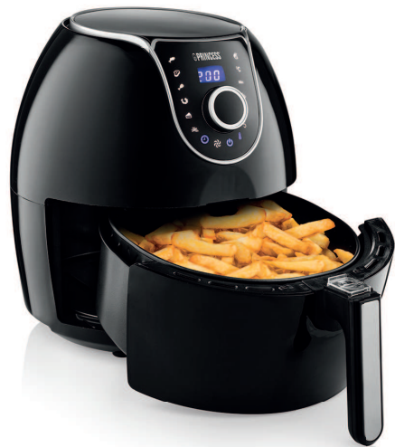
Aerofryer XXL 01.182055.01.001

PARTS DESCRIPTION / ONDERDELENBESCHRIJVING / DESCRIÇÃO DAS PEÇAS / TEILEBESCHREIBUNG / DESCRIPCIÓN DE LAS PIEZAS / DESCRIÇÃO DOS COMPONENTES / DESCRIZIONE DELLE PARTI / BESKRIVNING AV DELAR / OPIS CZĘŚCI / POPIS SOUČÁSTI / POPIS SUČASTI / ОПИСАНИЕ ЗАПЧАСТИ