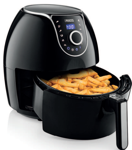
Aerofryer XXL 01.182055.01.001

PARTS DESCRIPTION / ONDERDELENBESCHRIJVING / DESCRIPTION DES PIÈCES / TEILBESCHREIBUNG / DESCRIPCIÓN DE LAS PIEZAS / DESCRIÇÃO DOS COMPONENTES / DESCRIZIONE DELLE PARTI / BESKRIVNING AV DELAR / OPIS CZĘŚCI / POPIS SOUČÁSTÍ / POPIS SUČASTI / ОПИСАНИЕ ЗАПЧАСТІ