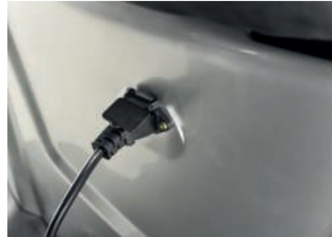
Laadaansluiting met oplader

Neem in geval van een lekkende accu contact op met uw dealer of de fabrikant.