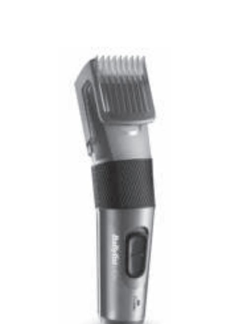
Fabriqué en Made in China