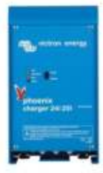
Phoenix Lader 24V 25A