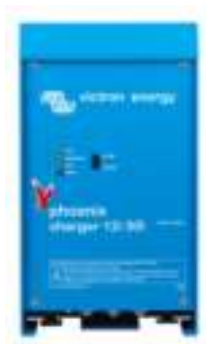
Phoenix Lader 12V 30A