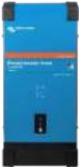
Phoenix Omvormer Smart 12/2000