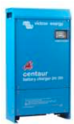
Centaur Lader 24 30