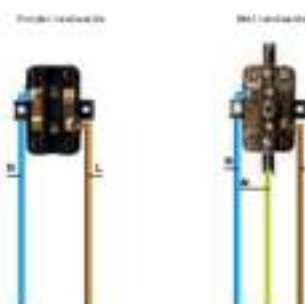
Wandcontactdoos (dubbel) Met/zonder randaarde

Wandcontactdoos voor montage op de muur om apparaten, lampen en verlengsnoeren op het elektriciteitsnet aan te sluiten.