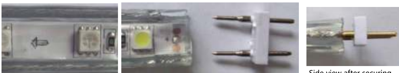
Side view after securing of the 2-pin connector

Secure the 2-pin connector to the strip first. Pay attention that the 2 pins touch tightly to the 2 wires of the strip.