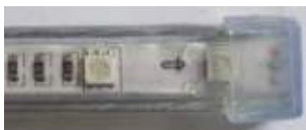
→ Tampa final