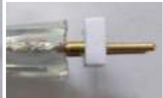
Seitenansicht nach Sicherung des 2-Pin Steckers

Sichern Sie den 2-Pin Stecker zuerst am Streifen. Achten Sie darauf, dass die 2 Stifte fest an den 2 Drähten des Streifens anliegen.