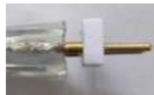
Vista lateral tras asegurar el conector de 2 pines

Asegurar primero el conector de 2 pines a la tira. Prestar atención ya que los dos pines deben tocar firmemente a los dos conductores de la tira.