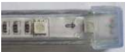
→ Tapa del extremo