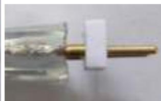
Vista lateral após a fixação do conector de 2 pinos

Certifique primeiro o conector de 2 pinos da tira. Preste atenção para que os 2 pinos se toquem firmemente aos 2 fios da tira.