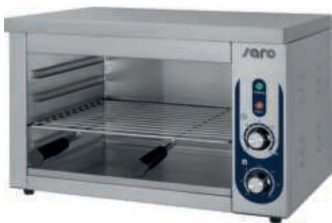
Modell LANA (443-1050)