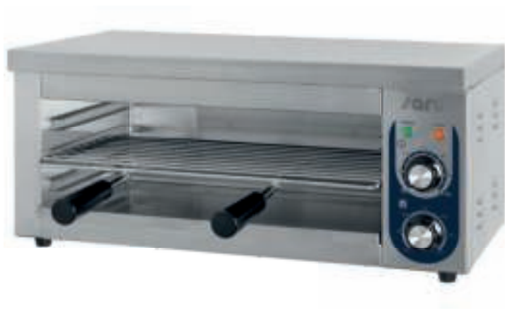
Modell LYNN (443-1055)