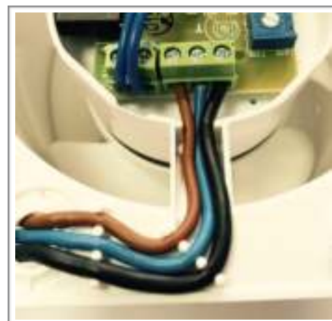
KW100T/KW125T: met timer & KW100H/KW125H: met timer en vochtsensor

U kunt het model KW100H/KW125H ook aansluiten ZONDER schakeldraad (zwart), dan wordt de ventilator automatisch aan/uit gezet door de vochtsensor