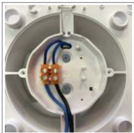
KW100/KW125: standaard (aan/uit)

Bruin = vaste voeding (L) - Blauw = nuldraad (N) - Zwart = schakeldraad (T) deze komt bijv. vanaf uw lichtschakelaar (via de lamp)