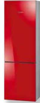
KG36SR30 - ROOD