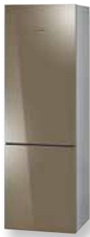
KG36SQ30 - QUARTZ