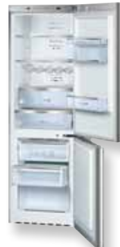
KG36SM30 - INOX