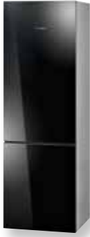
KG36SB40 - ZWART