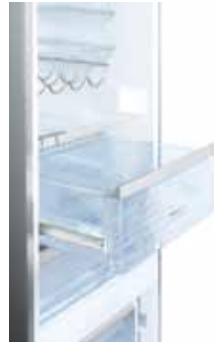
KG36S53 - ZWART