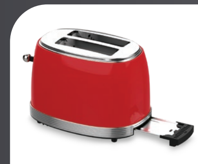
Bandeja recogemigas extraíble Easily removable Crumb tray Plateau ramasse-miettes amovible Bandeja de migalhas removível Abnehmbare Krümelschublade Vassoio raccogli briciole rimovibile