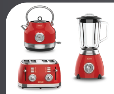
Productos Serie Retro Retro Serie products Produits de la Série Retro Produkte der Retro-Serie Prodotti della Serie Retro