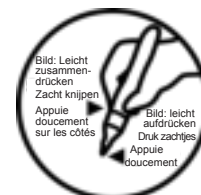
Bild: Leicht zusammendrücken Zacht knijpen Appuie doucement sur les côtés Bild: leicht aufdrücken Druk zachtjes Appuie doucement