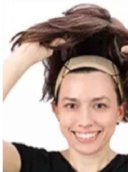
6. Zet de pruik vast met de oorlussen boven elk oor