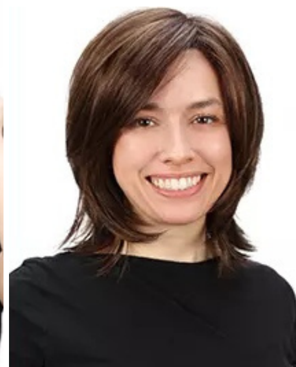
8. Stijl de pruik zoals gewenst