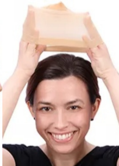
2. Doe het netje over je hoofd