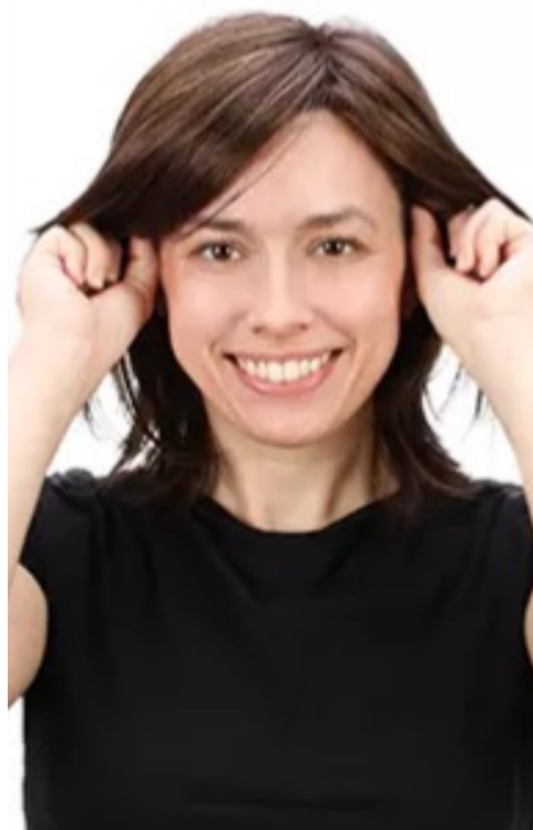
7. Pas de oorlussen aan indien nodig