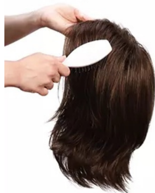
4. Kam de pruik goed door.