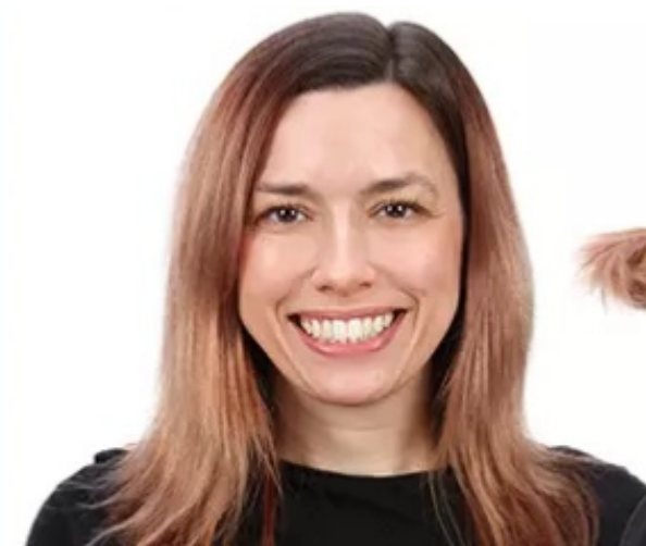
1. Kam je haar. Lang haar in een lage knot.