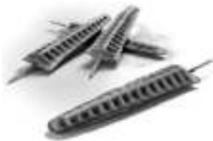
Lolly (kerstboom), driehoekig