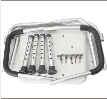
Step 1 Overzicht foto van onderdelen