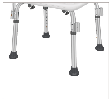
Step 9 Plaats nu de stoelpoten in de buizen en vergrendel deze door de drukknop uit te laten springen.