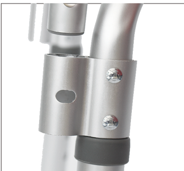
Step 10 Plaats de armleuningen en zorg dat de drukknoppen uitspringen.