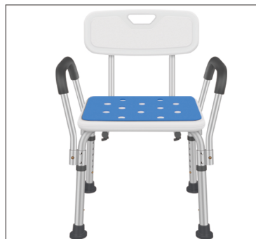
Step 7 Plaats de anti-slip kussens (blauw ter verduidelijking) op het zitvlak en de rugsteun van de stoel.