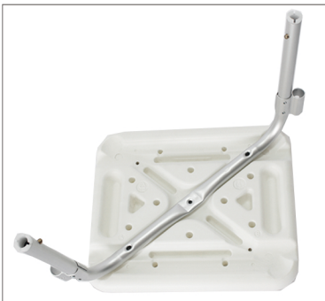
Step 4 Plaats de eerste buis, met de holle zijde naar beneden