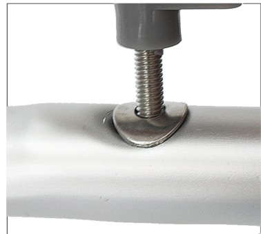
Step 6 Plaats een korte schroef op de plek waar beide buizen elkaar kruisen. Gebruik hierbij het ringetje zoals aangegeven