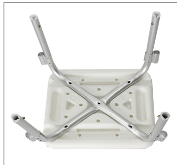
Step 5 Plaats de tweede buis met de bolle zijde naar boven.