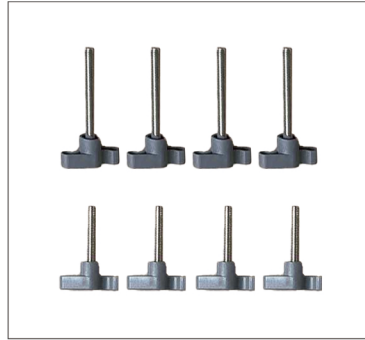
Step 2 Overzicht schoeven;