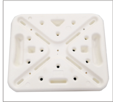
Step 3 Plaats het zitvlak van de stoel ondersteboven.