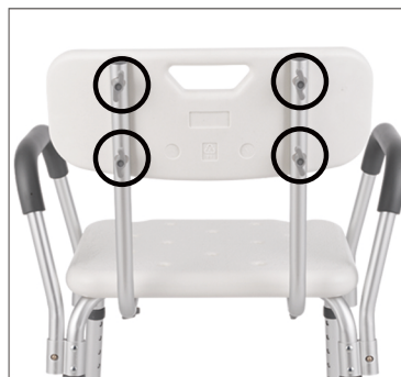
Step 8 Plaats rugsteun met (handvat naar boven) en bevestig deze met 4 korte schroeven