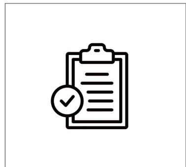
Step 7 Lees de veiligheidsvoorschriften, waarna de stoel gereed is voor gebruik.