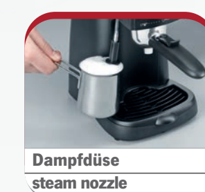
Dampfdüse steam nozzle