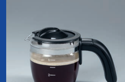
Dampfdüse steam nozzle

DE Automatischer Druckklass in Aus-Stellung GB Automatic pressure release at switch-off FR Libération automatique de la pression à l'arrêt de l'appareil NL Automatische druk verlossing tijdens uitschakelen DK Automatisk trykudligning når apparatet slukkes ES Descarga automática de la presión al apagar IT Rilascio automatico della pressione allo spegnimento PL Automatyczne wyrownwanie ciśnienia po wyłączeniu