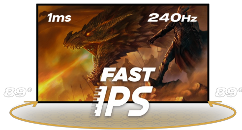
240Hz & 1ms MPRT

De Gold Phoenix is de ultieme monitorkeuze voor de doorgewinterde competitieve gamer. Met een verbluffende verversingssnelheid van 240Hz, een responstijd van 1ms en FreeSync Premium game je vloeiend op de zwaarste instellingen en heb je altijd een streepje voor op je tegenstanders. Ervaar levensechte kleuren op dit 27-inch Fast IPS-scherm met WQHD (2560x1440) resolutie en een helderheid van 400cd/m 2 . Met de Black Tuner functie pas je de helderheid aan in donkere ruimtes, zo zie je tegenstanders in het donker voor ze jou zien. Kantel, draai of verstel de monitor in hoogte om de juiste ergonomisch zithouding aan te nemen en geniet van alle comfort tijdens marathon gaming-sessies.