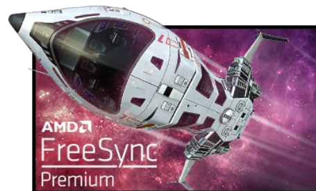
FreeSync™ Premium Technologie

De 240Hz Fast IPS-paneeltechnologie garandeert niet alleen betrouwbaarheid en levendige slagveldscènes die worden weergegeven met een voortreffelijke kleurnauwkeurigheid, maar biedt ook een uitstekende Moving Picture Response Time (MPRT) van 1ms.