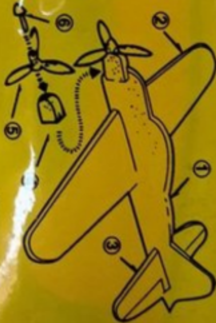
Image for reference only. The design is for reference only. Take the actual goods as the standard

WARNING: CHOKING HAZARD Small parts Not for children under 3 years MADE IN CHINA