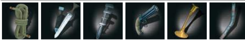
Touw Dolk Engelse sleutel Revolver Kandelaar Loden pijp