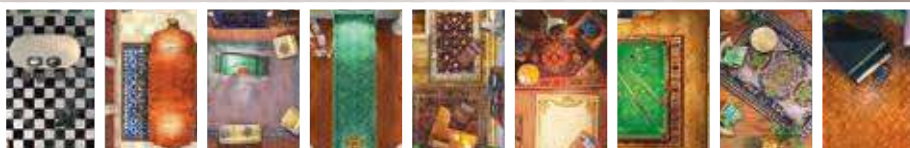
Keuken Eetkamer Zitkamer Hal Studeerkamer Bibliotheek Biljartkamer Serre Muziekkamer