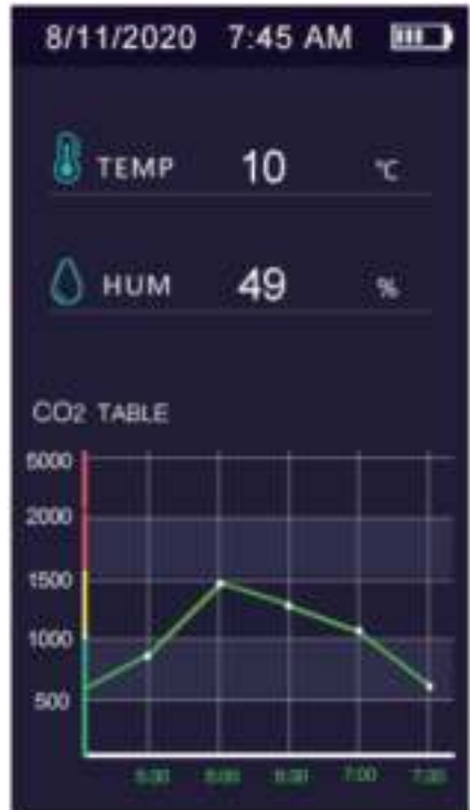
Figuur 2 Grafiekweergave