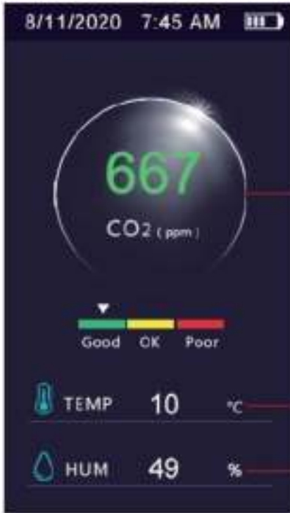
Figuur 1 Standaardweergave