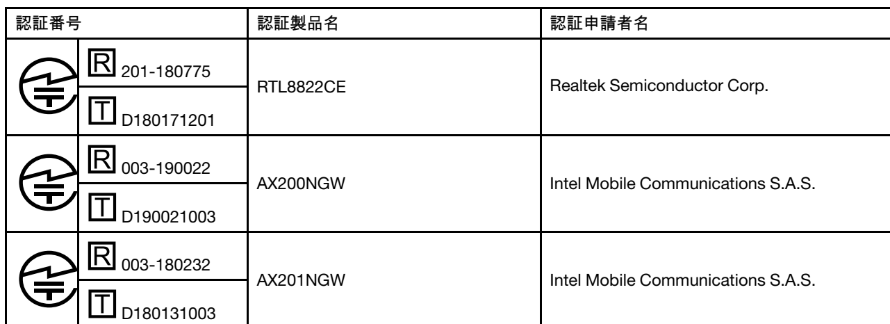
Table 1. 無線LAN / Bluetooth アダプターが搭載されているモデル

本製品が装備する無線アダプターは、電波法および電気通信事業法により技術基準認証を下記のとおり取得しています。本製品に組み込まれた無線設備を他の機器で使用する場合は、当該機器が上記と同じく認証を受けていることをご確認ください。認証されていない機器での使用は、電波法の規定により認められていません。