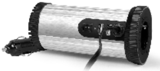
EG-PWC150-01 12 V CAR POWER INVERTER, 150 W