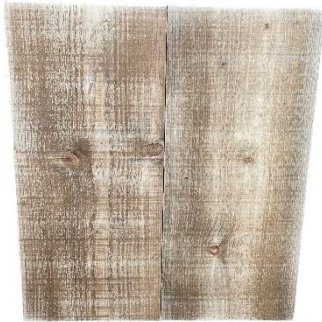
2 x zijpaneel