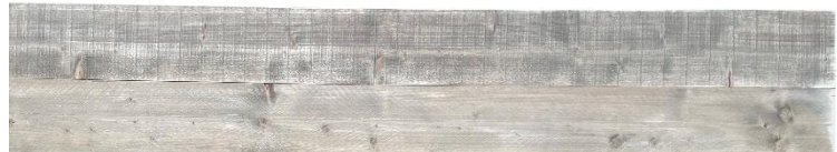
1 x het zitvlak