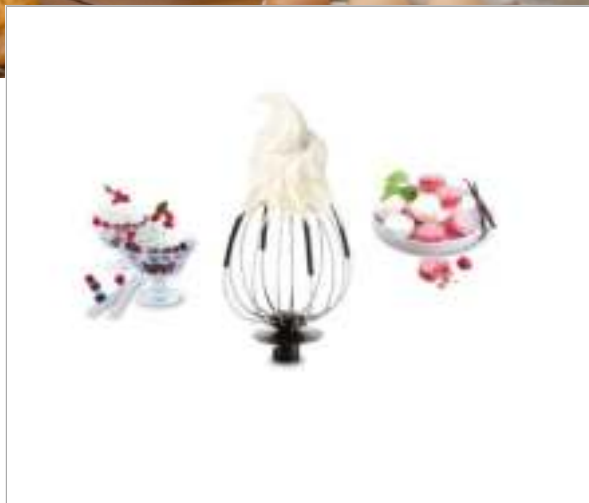
Keukenmachine Masterchef Gourmet QB602H38

Het perfecte gebak en nog veel meer, zonder er enige moeite voor te doen!