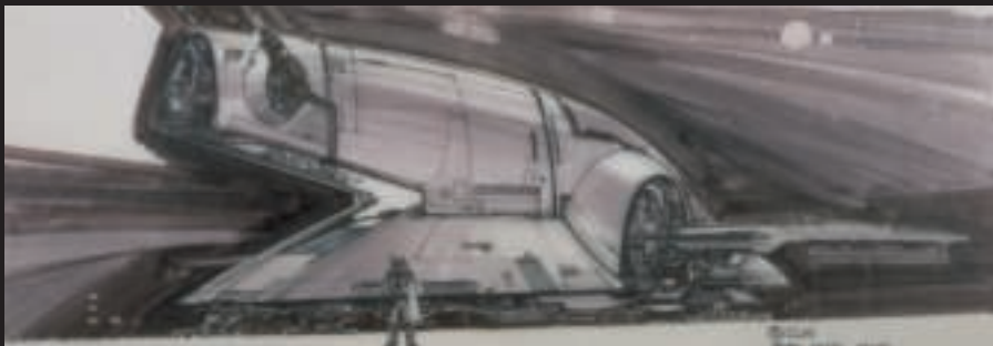
Esquisses © & ™ Lucasfilm Ltd.