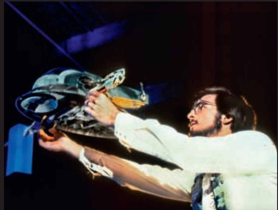
Ken Ralston, créateur des effets spéciaux © & ™ Lucasfilm Ltd.