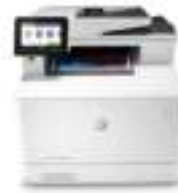
HP Color LaserJet Pro M479fnw

Deze printer is ontworpen om alleen te werken met cartridges die een nieuwe of hergebruikte HP-chip hebben. De printer gebruikt dynamische beveiligingsmaatregelen om cartridges te blokkeren die een chip hebben die niet van HP is. Periodieke firmware-updates behouden de effectiviteit van deze maatregelen en blokkeren cartridges die eerder wel werkten. Met een hergebruikte HP-chip kunt u hergebruikte, gerecyclede en opnieuw gevulde cartridges gebruiken. Meer informatie vindt u op: http://www.hp.com/learn/ds