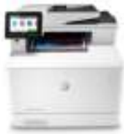
HP Color LaserJet Pro M479dw

Winnen in het bedrijfsleven betekent slimmer werken. De HP Color LaserJet Pro MFP M479 is ontworpen om u te laten focussen op de meest effectieve manier om uw bedrijf te laten groeien en de concurrentie voor te blijven.